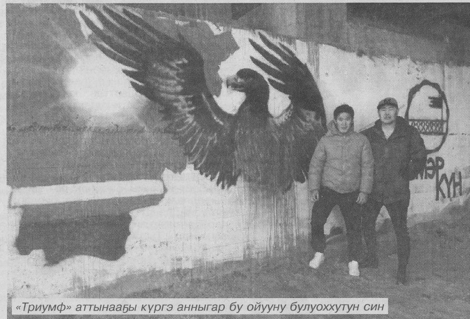
«Триумф» аттынаабы күргэ анныгар бу ойууну булуоххутун син

былаахпын тутуһан тоҕо ырыа айахтаһыны? Онтон сиеттэрэн кэнсиэрим өйдөбүлэ тахсан испитэ. Бииртэн биир санаа ситимнэһэн испитэ. Былаахпыт күнэ тоҕо суобуй? Ыччат биһиги дойдубут суолталаах күннэригэр тоҕо ис сүрэбиттэн тобуоруһа мустубатый? Сорох ытык күн судаарыстыбаннаска олус чугас буолан, ыччаты тэйтэр курдук эбит. Маннык ситим үөскээбитэ: биһиги күнгэ сүгүрүйэбит, күммүт былаахпытыгар баар, ол былаахпытын сиимбэл онгостон мустоохпутун сөп. Судургутук эттэххэ, «муода» буолуон бабарабын. Холобур, эдэр кыыс «бу мин былаабым» диэн мэлдьи илдьэ сылдьар, хоһугар ыйаан туруорар, суолтатын өйдүүр, сүүрэни батыһар. Дойдубутугар ытыллар тэрээһиннэри обургу оҕолор көрөллөр буоллаҕа уонна ол тэрээһингэ төһө улахан дуу, кыра дуу суолта биэрэллэрин өйдүүр, сыһыан үөскүүр. Ол иһин түмэр күнгэ суолта бэриллэн, сыһыан үөскүөн бабарабыт. Бу – ыччат бэйэбит күммүт буолуохтаах. Дьинг интэриэс үөскээтэбинэ, ыччат бэйэтэ да устуруйаны, кырдыгы билиэн бабата күүһүрүө этэ дии саныыбын. Сорох тойону көрсөн этэн көрбүтүм, сэргиир, сэнээрэр курдук буолбута, онтон быбар ааспытын кэнниттэн болбомтото убараата (күлэр). Бу кэнсиэргэ муспут санаабын, үлэм түмүгүн барытын тэбиэхтээхпин, ол иһин эстэпиэтэни ылан, эһиилги түмэр күнү ким эрэ атын бэлэмниэхтээх диэн толкуй баар. Аны туран, биһиэхэ, сахаларга, алтынны 14 күнэ – күһүнү кыһын солбуйар күнэ.