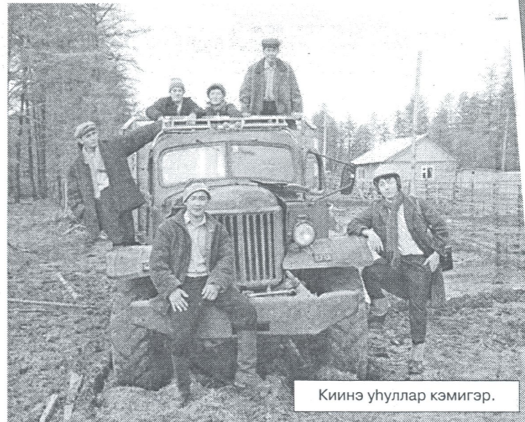
Киинэ уһулар кэмигэр.

сылдьың, эдэрдии эрчимгит хаһан да энчирээбэтин, дьолу баҕарабың!