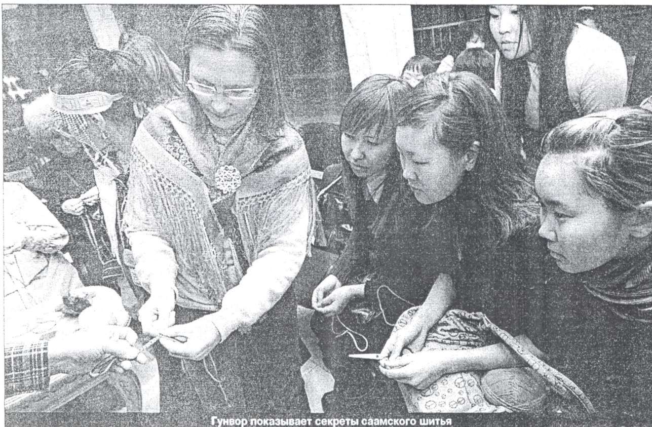
Гунвор показывает секреты саамского шитья

— Тут из Норвегии две саамки приехали. Будут наших мастеров учить унты шить. Интересно-тесть? Тогда приезжайте в Центр культуры