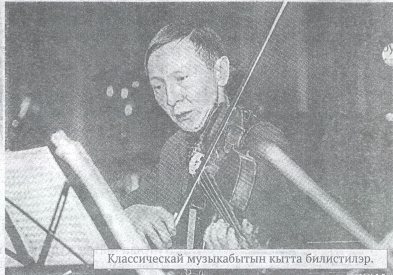
Классическай музыкабытын кытта билистилэр.