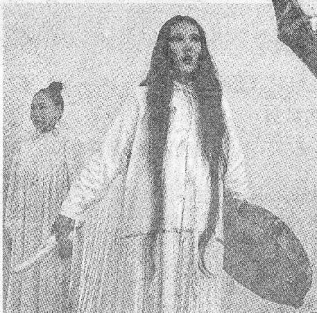
На московских зрителях «Удаганки» произвели сильное впечатление.

ставляли там все эти годы, так или иначе связаны с нашим эпосом».