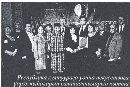
Республика култуурага уонна искусствога үөрэх кыһаларын салайааччыларын кытта

чугаһата сатааммын, учууталлыы оонньуурбун өйдүүбүн. Хантан эрэ кылаас журналын булбутум, онно оҕолор ааттарын суруйан баран, уроук ытыарым. Миэлинэн истиэнэҕэ этиилэри, тыллари быраабыланан ырыттарарым, үөрэнээччилэрбэр сыаналары туруорарым.